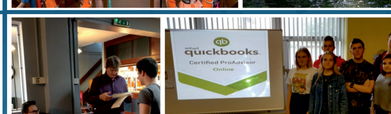
Bilston wrzesień 2019