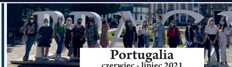
Portugalia czerwiec - lipiec 2021