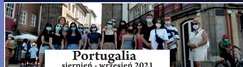
Portugalia sierpień - wrzesień 2021